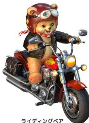
ライディングベア