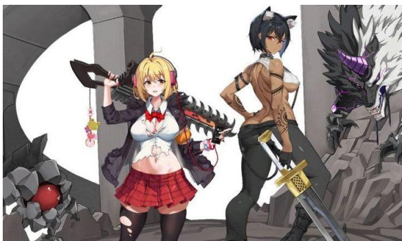
〈『ソウルワーカー』プレイ特典〉

『ソウルワーカー』コラボ記念イベントの詳細は、公式サイトのお知らせをご確認ください。