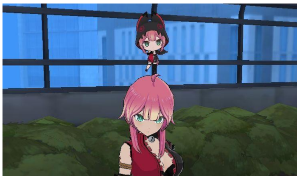
〈『ラストオリジン』プレイ特典〉

また、ゲームプレイを通じて特定条件を達成すると、コラボ先ゲーム内で使用できる限定アイテムが獲得できる連動イベントを『ラストオリジン』『ソウルワーカー』両タイトルで実施しています。10月30日（木）メンテナンス後は、『ソウルワーカー』で使用できる特典アイテムを「 ダンシング・チイ 」に更新しました。