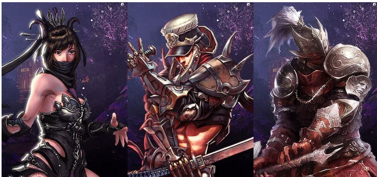
（左から）タオイスト、シャドウ、バーサーカー

今回のアップデートでは、「タオイスト（アービター）」「シャドウ（クロウ）」「バーサーカー（ブラッドテイカー）」のバランス調整を実施いたしました。